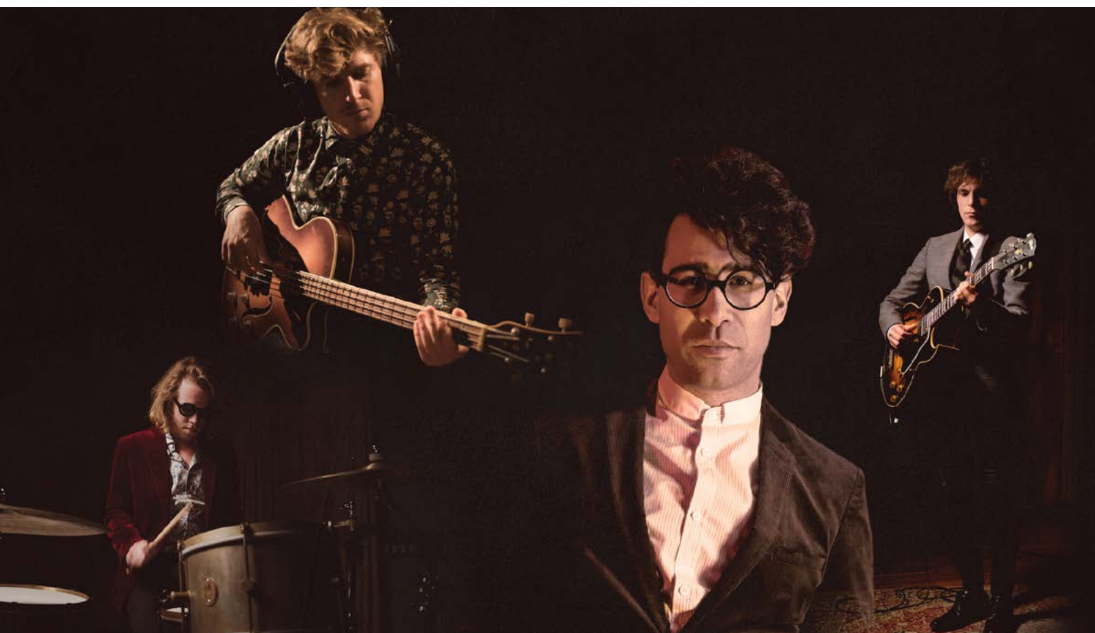
Pegasus «Unplugged»

Pegasus a enregistré son autobiographie musicale sous la forme d'un album acoustique unique intitulé «Unplugged». Il sortira le 15 janvier 2021 et rassemble tous les hits du groupe, tels que «Metropolitans», «I Take It All» et «Skyline», entièrement réarrangés en versions acoustiques. En plus des deux nouveaux singles «Victoria Line» avec Anna Rossinelli et «Better Man», l'annonce d'un troisième titre inédit ravit les fans. Le son intemporel de l'album s'inscrit parfaitement dans l'actualité mais trouve son origine dans la Rue du Stand de Bienne, où les quatre garçons du quartier ont commencé à écrire l'histoire de leur ascension il y a 20 ans.